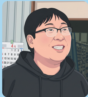
岩国自興のパパ社員

仕事と子育てを両立し、イキイキと働くパパ・ママ社員。家族の存在を原動力に、温かい職場のサポートを受けながら奮闘する社員の声をお届けします！