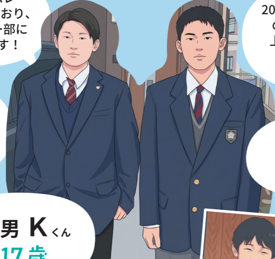
長男 Kくん 17歳

2026年4月から強豪校の寮に入り、さらに上を目指してバレーボールの練習に励んでいます！