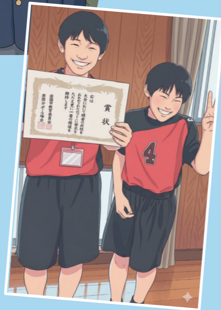
次男 Nくん 15歳

2026年4月から強豪校の寮に入り、さらに上を目指してバレーボールの練習に励んでいます！