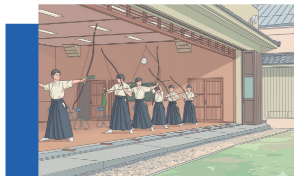
▲高校時代、弓道部での1枚

一方で、部品商としての専門業務には苦戦した。特に事故車の修理に伴う発注は、ボルト1本まで適合させる必要があり、部品点数も膨大になる。知識不足に戸惑う場面では独断を避け、先輩や