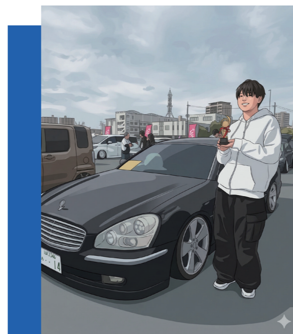
▲車のイベントにて

営業面では、部品の話で盛り上がりつつも、最後のワンプッシュができない点に課題を感じているという。それでも、まずは世間話から信頼関係を築くことや、商品の良さを具体的に伝えるといった先輩からの助言を素早く実践し、苦手意識と向き合っている。Iにとって、未知の知識に触れることは苦ではない。覚えることは多いが、大変さよりも知る喜びが勝つのだ。成約へのハードルは高いが、現場へ足を運び続けるその足取りは軽い。