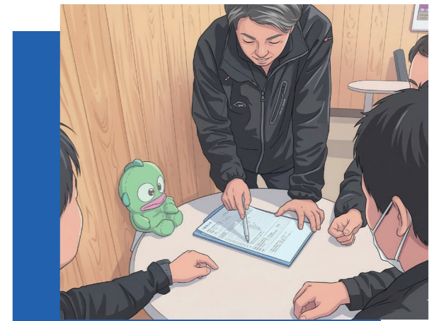
▲仕事に向き合うTさん

それは、失敗を恐れず挑戦できる状態のこと。その定義に触れたとき、全身に電撃が走るのを感じた。防府営業所時代に自分が作れなかった環境