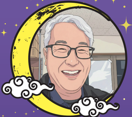
宇部営業所 副所長

上の子が高校3年生で、受験や部活に忙しい年でした。山口県の高校バレーは誠英高等学校が強く、娘の高校はNo.2。結局、今年もその壁を越えられなかったようです。とはいえ、娘のサポートは妻が注力していたため、私は本当に「のんびらり」とした1年に。健康面も去年から変わらず、問題なく過ごせています。面白くない1年かもしれませんが、平穏無事が一番。ただ、うちの子どもたちは年子で、2026年は下の子が3年生に。引き続き受験が続くため、父としてはしっかり稼がないといけません(笑)